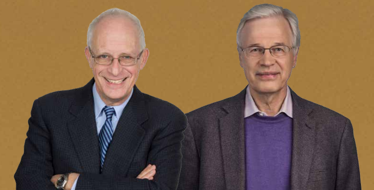
Foto: Porträt von Oliver Hart: Krisz Szabó; © Harvard University; Porträt von Bengt Holmström: © MIT Economics/Rick Barr Photography